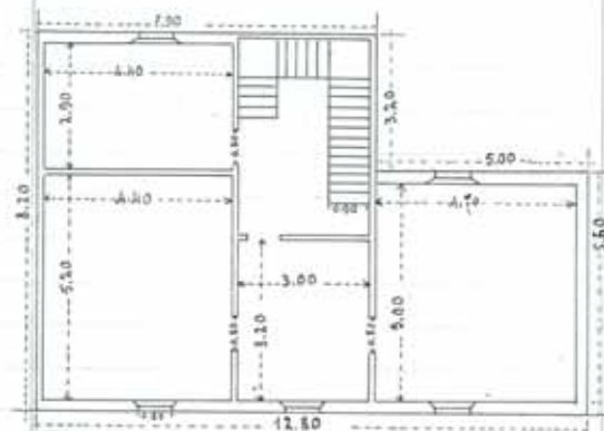
Pianta Prima Sup. 1:100