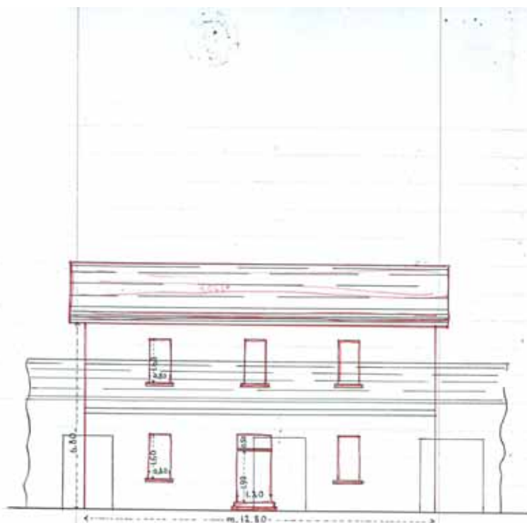
Prospetto - Scala 1:100